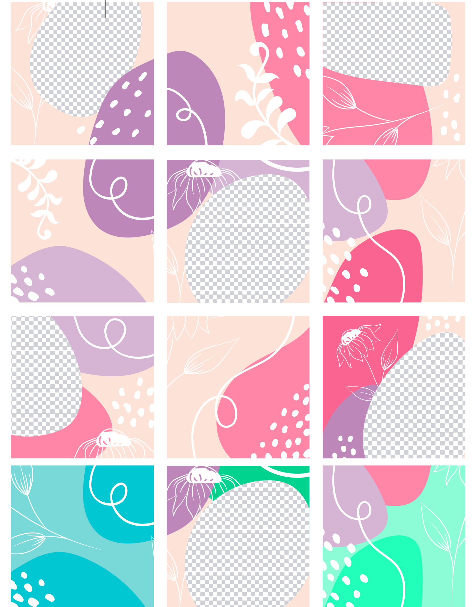
Propuesta estilo de publicaciones